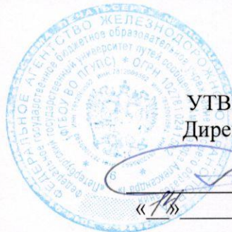
График промежуточной аттестации по основной образовательной программе среднего профессионального образования по ППССЗ Электроснабжение (по отраслям) студентов 4 курса заочной формы обучения специальности 13.02.07 Электроснабжение (по отраслям) на 1-й семестр 2024/2025 учебного года.